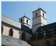
Museum der Stadt Worms im Andreasstift Weckerlingplatz 7 · 67547 Worms www.museum-andreasstift.de