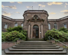
Museum Heylshof Stephansgasse 9 · 67547 Worms www.heylishof.de