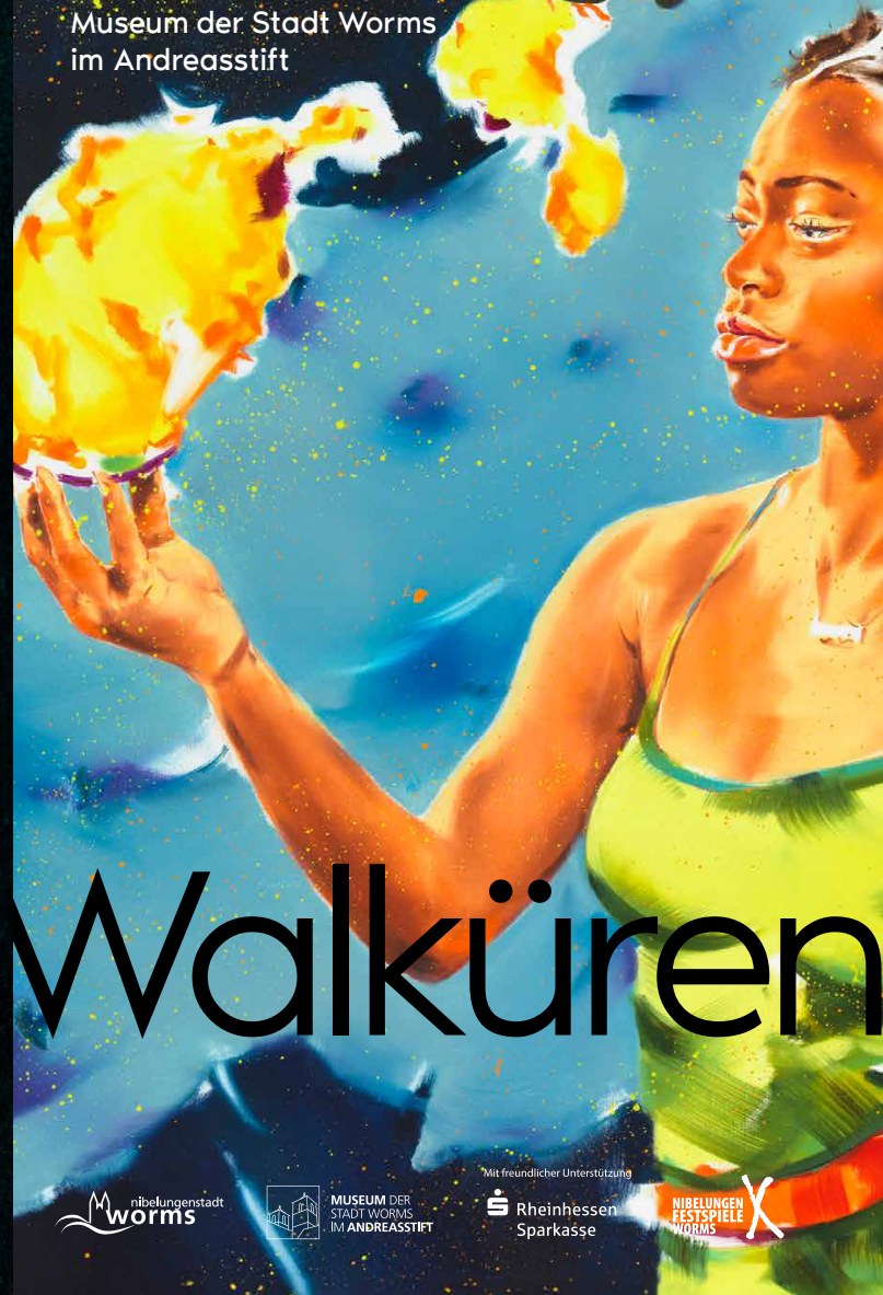
Titel: „Siegfrüne“, von Norbert Bisky, Foto: Bernd Borchardt